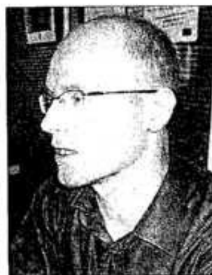
Le collaborateur d'Adia vient régulièrement à Dreux.

Les Yvelines d'après Christophe Durmort sont une bonne porte de sortie pour les jeunes du bassin d'emploi à la recherche d'un emploi. « Les jeunes de l'arrondissement de Dreux sont plus mobiles que les jeunes Parisiens qui n'ont guère envie d'aller travailler en banlieue. Dreux fait